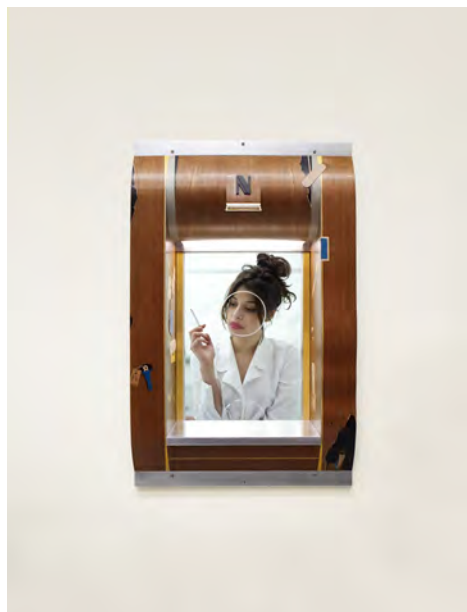
Camille Blatrix, NiNa , 2014, mahogany, marqueterie de bois, aluminium, argent, verre, vis de fixation, 88 × 55 × 27 cm.