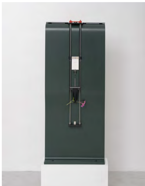
Camille Blatrix, Sans titre 1 , 2017, résine, MDF laqué, acier inoxydable, plexiglas, caoutchouc, papier, péridot, 80 × 45,5 × 18,5 cm.

DES VUES DE L'EXPOSITION SERONT DISPONIBLES APRÈS LE VERNISSAGE.