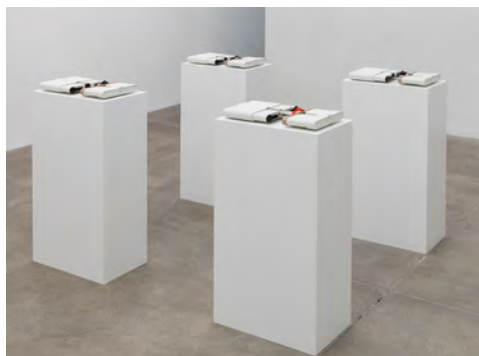
Vue de l'exposition collective Camille Blatrix, Franco Vaccari , 2017, galerie Andrew Kreps (New York, États-Unis).