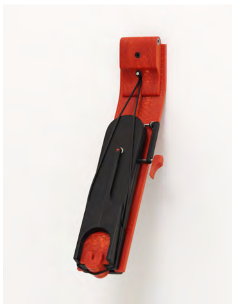
Camille Blatrix, Ambird , 2017, résine, corail, acier inoxydable, caoutchouc, 25 × 5 × 12 cm.