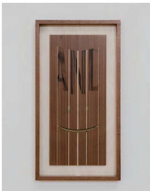
Camille Blatrix, And... , 2018, acajou, marqueterie de bois, miroir, 65 × 35 × 4 cm. Courtesy de l'artiste et de la galerie Balice Hertling. Photo © Stefan Stark.