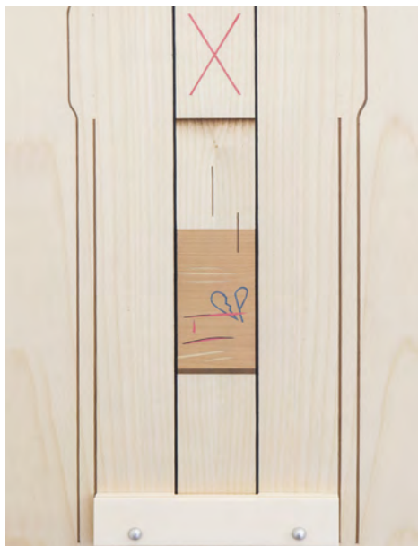
Camille Blatrix, Skin (détail), 2016, marqueterie de bois, ivoire synthétique, aluminium, 35 × 90 cm.