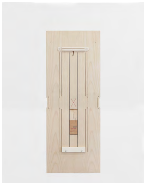
Camille Blatrix, Skin , 2016, marqueterie de bois, ivoire synthétique, aluminium, 35 × 90 cm.

DES VUES DE L'EXPOSITION SERONT DISPONIBLES APRÈS LE VERNISSAGE.