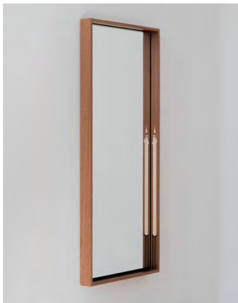
Camille Blatrix, Two Candles , 2018, acajou, marqueterie de bois, miroir, 12 × 55 × 6 cm. Courtesy de l'artiste et de la galerie Balice Hertling. Photo © Stefan Stark.

DES VUES DE L'EXPOSITION SERONT DISPONIBLES APRÈS LE VERNISSAGE.