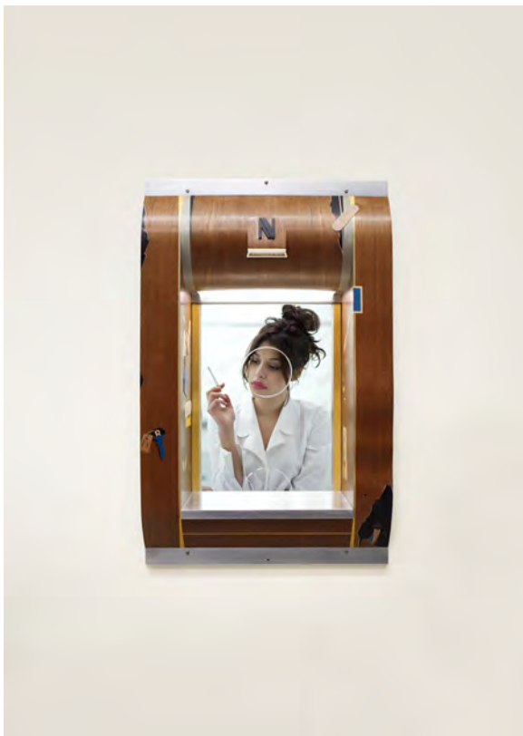
Camille Blatrix, NiNa , 2014, mahogany, marqueterie de bois, aluminium, argent, verre, vis de fixation, 88 × 55 × 27 cm. Courtesy de l'artiste et de la galerie Balice Hertling © DR.

« Les sculptures de Camille Blatrix, qu'il nomme " objets émotionnels ", s'apparentent à des productions industrielles étranges, artefacts improbables issus d'une société techno-capitaliste déviante. Ses médiums de prédilection (bois, aluminium, verre...), alliés à des savoir-faire complexes (comme la modélisation 3D), sont travaillés comme dans des processus d'usinage, quoique ici tout relève de la main, avec une rigueur et un soin obsessionnels. En découle une finition impeccable, dont la froideur formelle est contrebalancée par la présence indicielle de motifs relevant de l'intime (feuille de papier déchirée, notes manuscrites, fleur ou larmes). Un peu comme si une facture exagérément industrielle devait recouvrir un registre d'intensités émotionnelles pour le canaliser, le standardiser et le diffuser. Dès lors, ces objets-simulacres à l'usage incertain, hésitant entre fonction et ornementation, dérivent vers l'imaginaire, l'onirisme ou le surréalisme. Ils entretiennent une forme de séduction et de sensualité dont on ne sait si elle résiste ou au contraire résulte de leur caractère " corporate ". Autour de ces objets ambigus, l'artiste pratique également le dessin et réalise des tableaux en marqueterie qui incluent des motifs figuratifs, là encore hésitant entre symbolisme pictural, allégorie et communication graphique. Le tout forme une œuvre troublante jouant sur des tensions entre design et sculpture, raison et désirs, naturalité et artificialité.