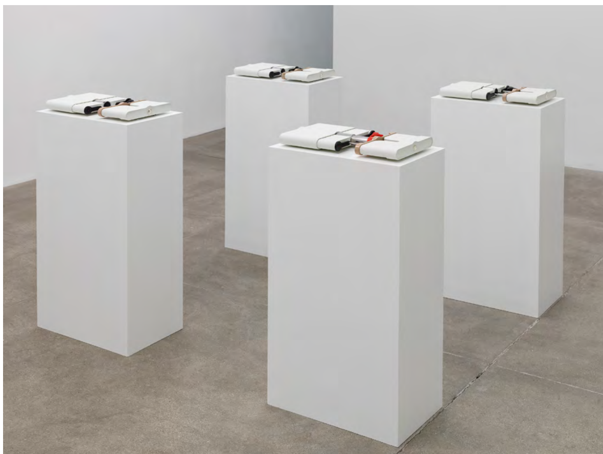
Vue de l'exposition collective Camille Blatrix, Franco Vaccari , 2017, galerie Andrew Kreps (New York, États-Unis).

« Matters of Concern | Matières à panser » fait suite aux deux précédents cycles d'expositions intitulés « Des gestes de la pensée » (2013-2016) et « Poésie balistique » (2016-2019), présentés à La Verrière.