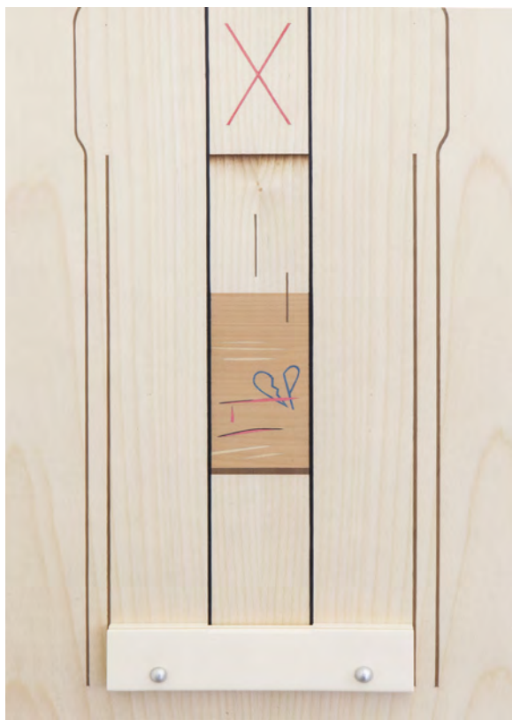
Camille Blatrix, Skin (détail), 2016, marqueterie de bois, ivoire synthétique, aluminium, 35 x 90 cm.

mais en l'actualisant par des enjeux contemporains. Un engagement du corps et de l'esprit qui, chez Blatrix, est plus immanente que transcendante. Son économie artistique repose sur un accueil des émotions et des intuitions directes, parfois teintées d'une certaine mélancolie qu'il laisse imprégner les matières et les formes. Un matérialisme sentimental qui est à l'opposé de l'ironie et du cynisme de certaines pratiques sculpturales postmodernes. L'art de Blatrix mise plutôt sur une croyance dans la capacité de la matière physique à condenser