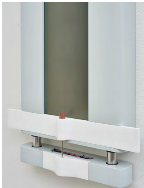
Camille Blatrix, Locker (détail) , 2016, MDF peint, résine, plexiglas, bois, argent, aluminium, plastique, 90 × 25 × 20 cm.