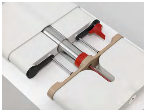
Camille Blatrix, Untitled (détail), 2017, plastique, peinture, acier inoxydable, argent, plexiglas, impression sur aluminium en oxydation anodique, 5 × 42 × 27 cm. Courtesy de l'artiste, de la galerie Balice Hertling et de la galerie Andrew Kreps. Photo © Dario Lasagni.